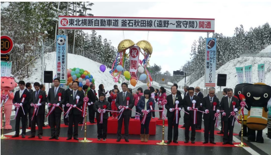
▲テープカット及びくす玉開き