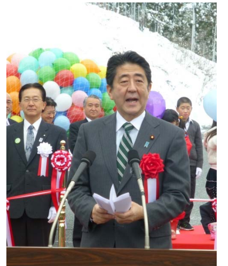
▲安倍晋三内閣総理大臣 祝辞