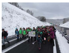
▲本線で同時開催されたマラソン&ウォーキング大会