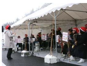
▲地元中学校の吹奏楽