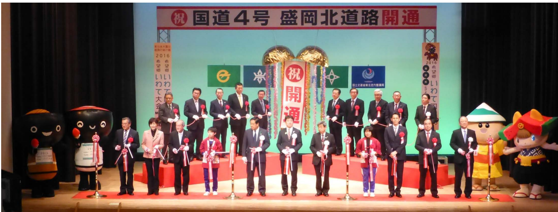
▲テープカット及びくす玉開き

盛岡北道路は4車線区間に挟まれて、旅行速度が4割程度遅い状態が解消され、今後は盛岡市北部地域から盛岡市中心部への交通の混雑緩和、安定した救急搬送ルートを確保、特産品である農産物輸送の支援、災害発生時における物流拠点へのアクセスを支援する等の効果が見込まれています。