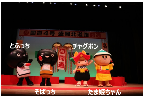
▲ゆるキャラの皆さん