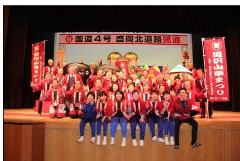
▲滝沢山車まつり実行委員会の皆さん