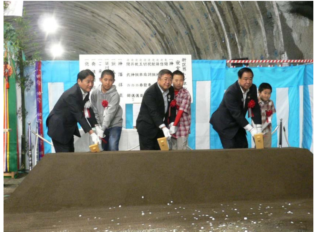
地元の児童も鍬入れ式に参加しました