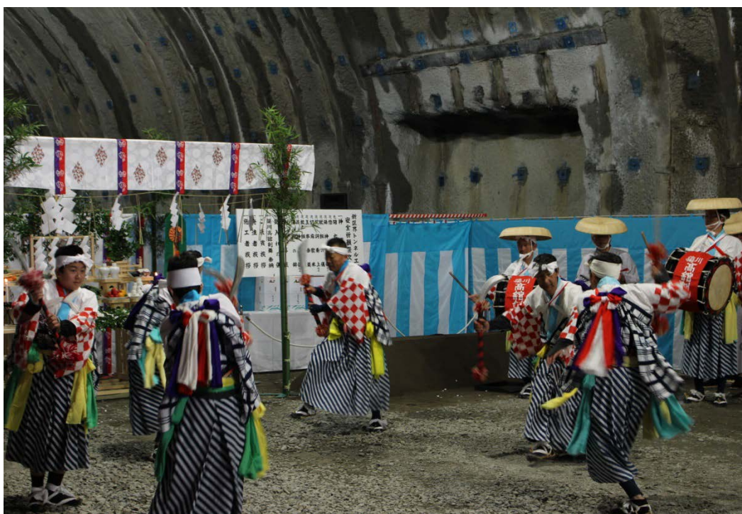
剣舞を奉納した高館剣舞保存会の皆さん