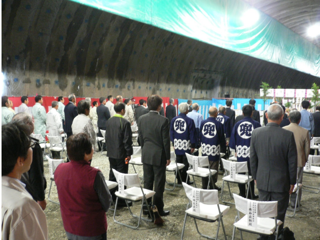
地元の方や工事関係者約100人が参列しました

6月28日(日)、宮古市区界地内において しんくざかい 新区界トンネル工事の安全祈願祭が実施されました。当日はあいにくの天気となりましたが、地元の方々や工事関係者等、約100人が参列しました。神事では復興庁岩手復興局長、宮古市長、盛岡市長等による「玉串奉奠」等を行い、被災地の1日も早い復興と工事の安全を祈願しました。また、神事終了後には地元の児童と一緒に鍬入れ式を実施した他、築川高館剣舞の奉納、宮古市長、盛岡市長の来賓挨拶等が行われました。完成すれば岩手県内最長となる新区界トンネルは本格的な掘削工事に入ります。