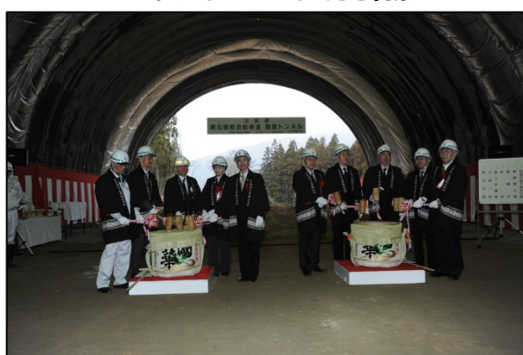
▲貫通を祝した鏡開き

東北横断自動車道釜石秋田線は復興支援道路として位置付けられており、かつてないスピードで工事を進めております。遠野住田～遠野についても平成30年度の開通が予定されており、今後も工事を進めて参りますので、引き続き皆様のご理解とご協力をお願いします。