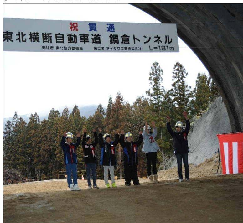
▲貫通点通り初めの様子