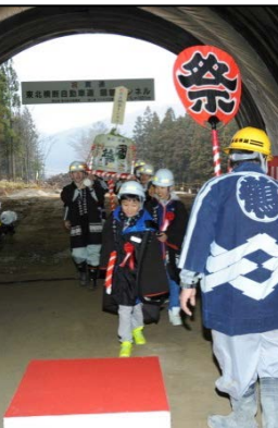
▲遠野小児童たちが神輿を担いで貫通を祝いました