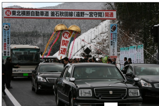
▲安倍総理を先頭にパレード開始