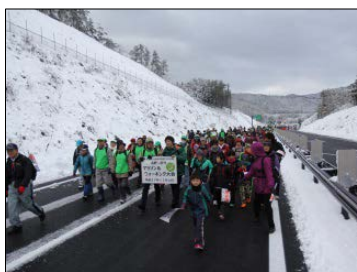
▲本線で同時開催されたマラソン&ウォーキング大会