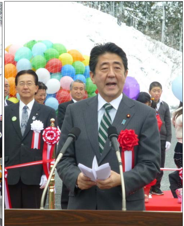
▲安倍晋三内閣総理大臣 祝辞