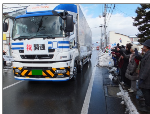
▲市内での開通パレードの様子