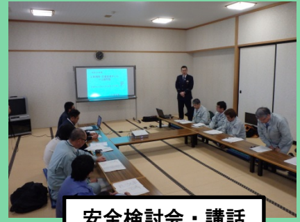
安全検討会・講話