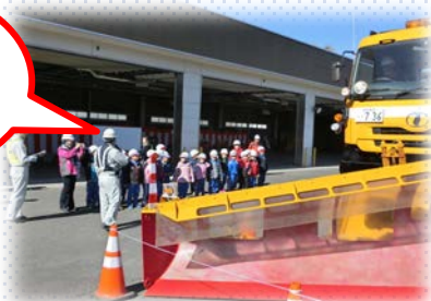
★除雪機械体験搭乗★