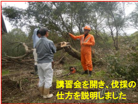
講習会を開き、伐採の仕方を説明しました

9月にはご協力いただける方が決定し、現在伐採作業が始まっています。作業期間は今年の10月7日から来年の9月30日までです。