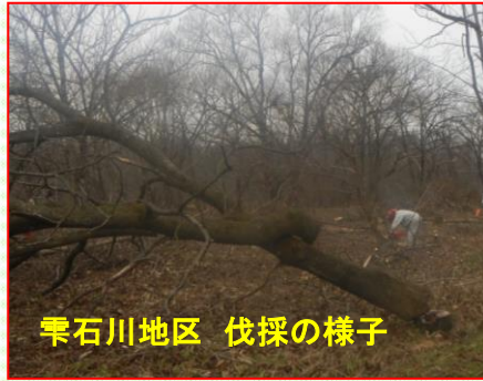
雫石川地区 伐採の様子