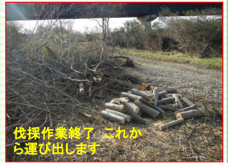
伐採作業終了 これから運び出します