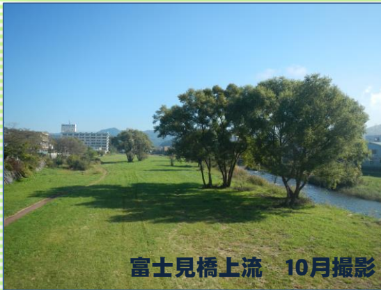
富士見橋上流 10月撮影

写真は、10月に撮影した富士見橋上流と、同じ場所を12月に撮影したものです。比べてみると、少しだけ木が減っているのがわかりますか??