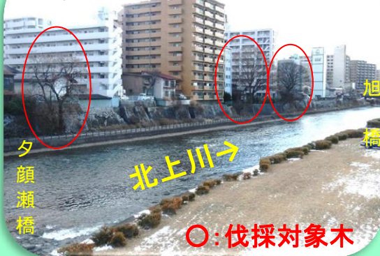
伐採したのはこちらの3箇所

北上川左岸の材木町（旭橋～夕顔瀬橋）で樹木の伐採を行いました。 以前もりかわ通信で、10月に行われた材木町裏石組案内看板除幕式の様子をご紹介しました。「材木町裏石組」とは北上川の旭橋～夕顔瀬橋の左岸に築かれた延長361m、高さ3～5mの石積で、古ものは江戸時代末期に造られた歴史ある石組です。 その石組から生えていた樹木が成長し石組にヒビが入るなど不安定な状況となっているため、3箇所ですべて樹木伐採を行いました。樹齢100年を越える大樹の伐採も行いましたので、その様子をご紹介します。