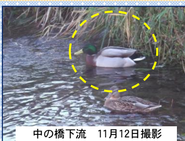
中の橋下流 11月12日撮影

まれな冬鳥として全国の湖沼や河川に渡来するが少ない。ヒドリガモに似ていることがある。オスは目の後方に緑色の光沢部分があるのが特徴。