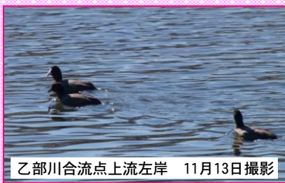
乙部川合流点上流左岸 11月13日撮影