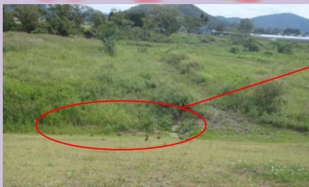
9月上旬、北上川右岸の井戸向橋上流八幡堤防を巡視パトロール中に鳥の群を発見・・・