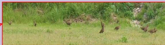
キジに似ていますが、ヤマドリです。