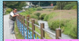
通行中の方が川を覗いてサケを見て行きます