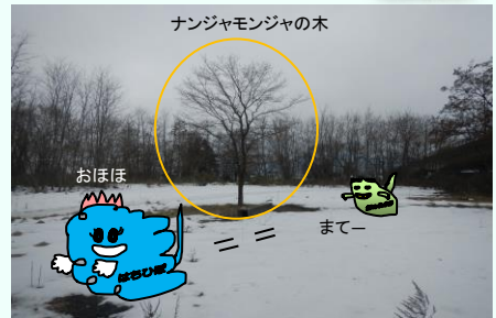
ナンジャモンジャの木

・幹は灰褐色でたてに切れ目が入る。 ・花期は初夏～夏にかけて。新枝の先に10cmほどの円錐形のふわふわした花を付ける。