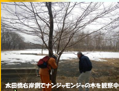
太田橋右岸側でナンジャモンジャの木を観察中