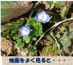
地面をよく見ると・・・