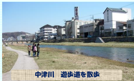
中津川 遊歩道を散歩