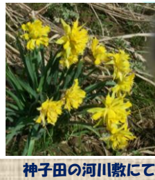
神子田の河川敷にて