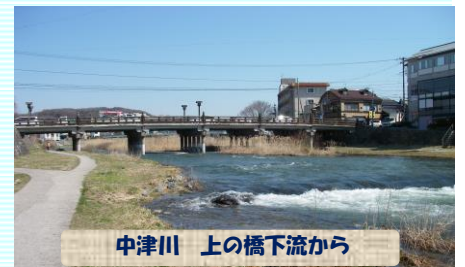
中津川 上の橋下流から