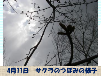
4月11日 サクラのつぼみの様子