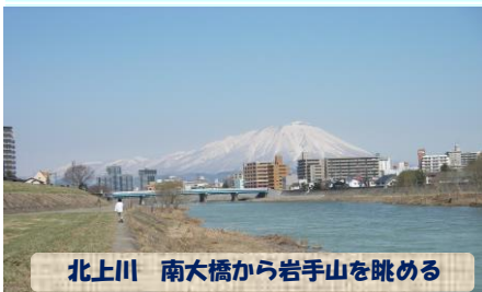
北上川 南大橋から岩手山を眺める

近ごろは日中もだいぶ暖かく、外出に上着が必要ない日も増えてきました。花粉症の方には大変な季節ですが、お散歩好きには待ちにまったシーズン到来です。毎日急成長する草花を見ていると、こちらまで元気がもらえるようです。今回は、川べりでたくさんの春を見つけたので、ご紹介します。