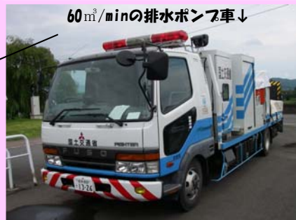
60 m /minの排水ポンプ車↓

排水ポンプ車は、大雨が降って家や道路がみずびたしになったときに、力を発揮するんだ。