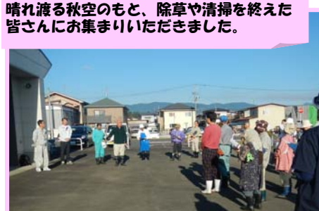
晴れ渡る秋空のもと、除草や清掃を終えた皆さんにお集まりいただきました。