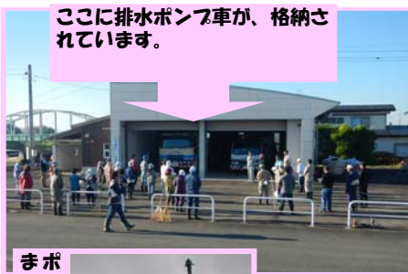
ここに排水ポンプ車が、格納されています。

平成25年9月28日（土）石鳥谷水辺プラザで、排水ポンプ車の説明会が行われました。当日は、朝早く水辺プラザ施設周辺の清掃活動等を終えた、石鳥谷五区の40名以上の方々が参加されました。住民の皆さんは、大きなポンプを間近でみてその大きさに驚き、ポンプの持つ能力について説明を受けて新たな発見があったようです。また、9月に台風18号が発生した折には、60 m /minの排水ポンプ車が（稼働はしなかったものの）出動した様子を説明されて「こういう大きな排水ポンプ車が配備されていれば、心強いですね」といった感想も聞かれました。