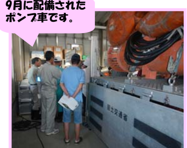
9月に配備されたポンプ車です。