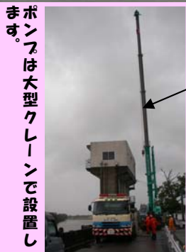
ポンプは大型クレーンで設置します。