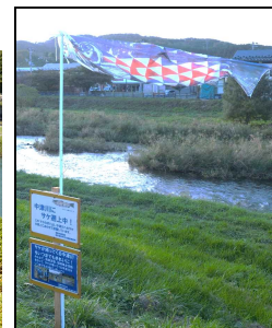
【R4.10.18 サケのぼり看板(中津川)】

サケが遡上してくる毎年この時期に「サケのぼり」看板を設置しています。中津川の数カ所に設置していますので見つけてみてね！ 写真の看板は「浅岸橋」です。