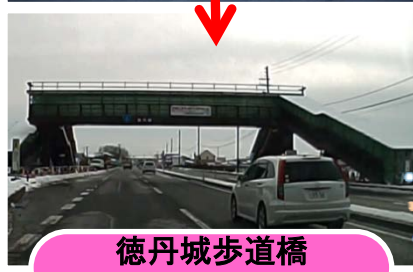
徳丹城歩道橋 (矢巾町)