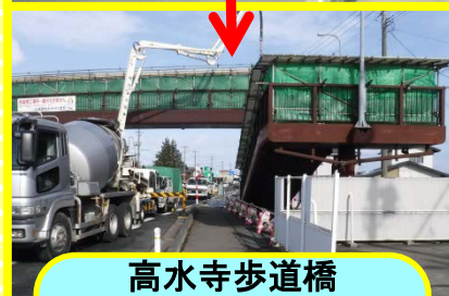
高水寺歩道橋 (紫波町)