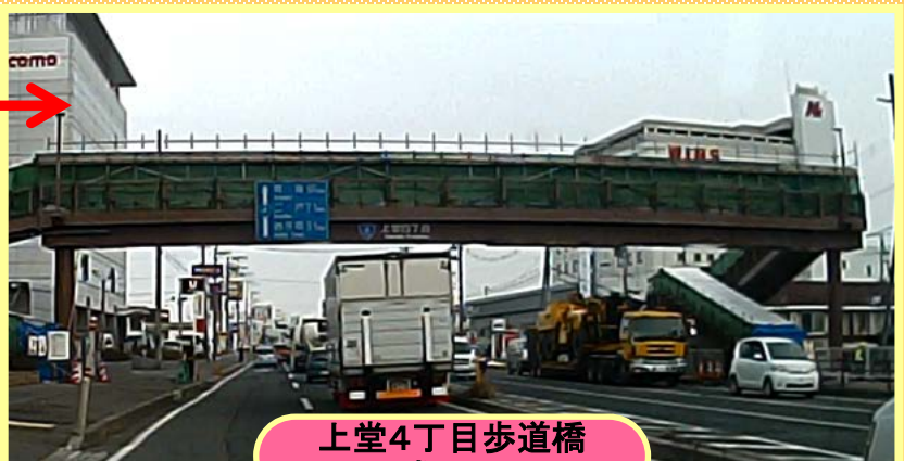
上堂4丁目歩道橋 (盛岡市)

それぞれ、2月末と3月下旬までを通行止め期間としております。通行止め工事 期間中は近隣の皆様にご不便をお掛けして大変申し訳ありませんが、安全第一 に工事を進めて参りますので、何卒ご理解とご協力の程よろしくお願ひします。