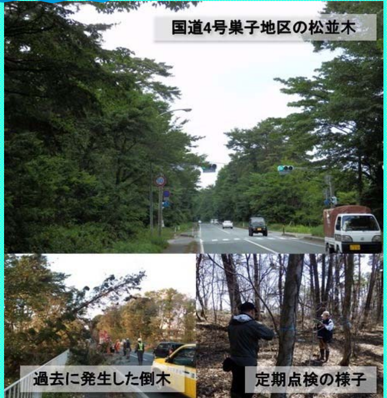
国道4号巣子地区の松並木

作業は12月21日から1月末までの予定で、年末年始の12月26日から1月5日を除く平日の9時から16時頃を予定しています。片側交互通行での作業になりますので、渋滞が予想されます。降雪期も重なりますので、お出かけの際は余裕を持った行程で安全運転をお願いいたします。