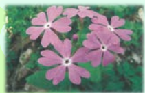
サクラソウ (5月初旬)

現存する松並木や、岩手山の眺望、周辺に生息・生育する動植物等、景観や自然環境に配慮したみちづくりを進めています。