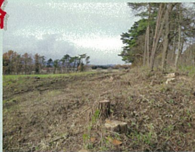
樹木伐採、土盛り、整地を行い道路を造っていきます。