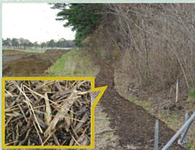
点検路には伐採した木を砕いて作ったチップが敷き詰められています。チップは時間とともに土に戻ります。