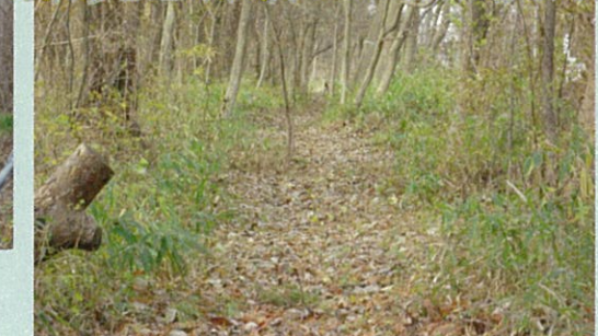
自然状態を保全しながら点検路が整備されました。

道路に石や木が落ちてる！ 道路に穴があいてて危ない！ ガードレールが壊れてる！ 故障車発見！・・・などなど