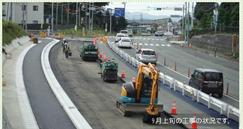
9月上旬の工事の状況です。