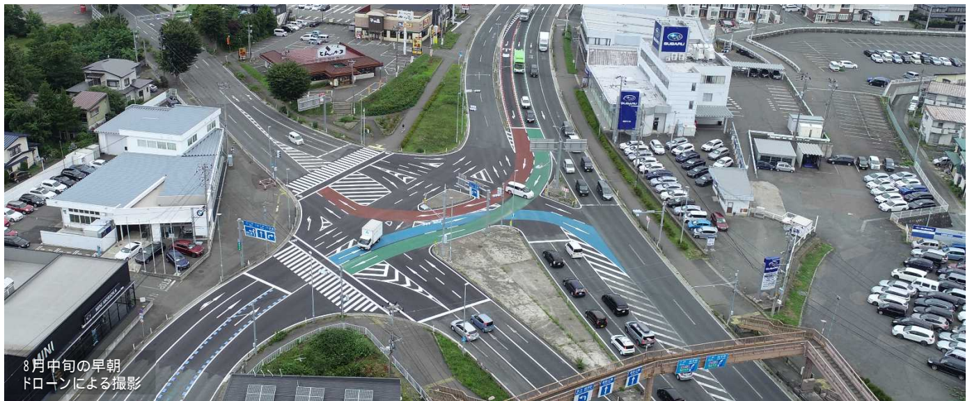
8月中旬の早朝 ドローンによる撮影

令和2年8月に完成した工事をご紹介します。一般国道4号 盛岡市上堂地内「上堂交差点」付近の舗装の塗りなおしの工事です。 工事の詳細については、盛国だよりバックナンバー第82号(7月3日発行)をご覧ください。