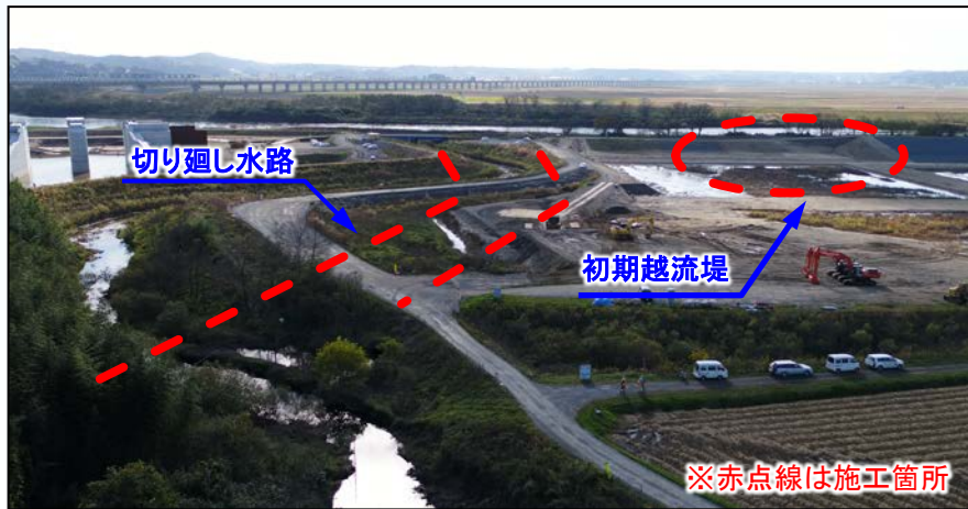
施工前 UAVによる空撮