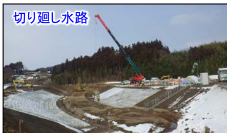
護岸ブロック設置の状況