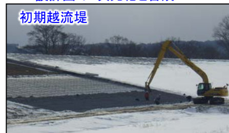
多自然型護岸(カゴマット)施工の状況

◆◆編集後記◆◆ 二十四節季では「雨水(うすい)」の季節。降る雪が雨へと変わり、雪解けが始まる頃のこと。最近日はも長くなり、日中の曇りが春へと少しづつ近づいているような気がします♪(や)