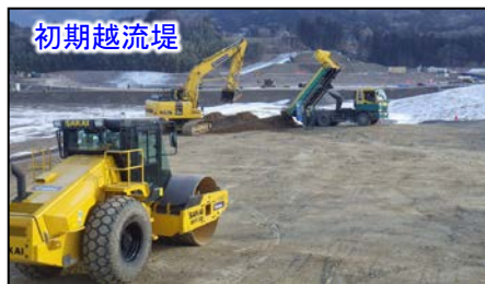
GPS制御建機での築堤盛土の状況