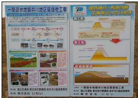
工事概要の説明看板