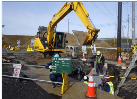
付帯道路施工状況