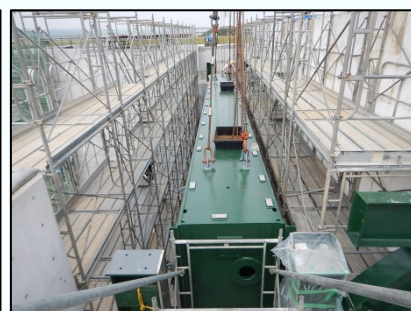
ゲート扉体組立状況