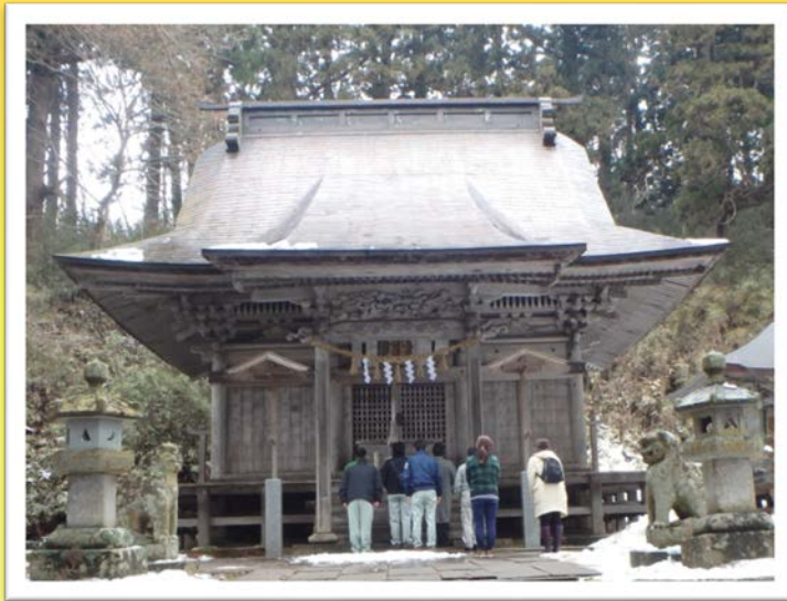
今年も年始には一関市にある配志和神社を参拝し、無事故・無災害を祈念しました。

皆様、新年あけましておめでとうございます。 昨年中は「i・report (あいれぽーと)」をご愛読頂きありがとうございました。 今年も一関地区の工事や地域の情報、北上川学習交流館「あいれぽーと」の話題などをわかりやすくお伝えできるよう努力していきたいと思っております。 また1年間どうぞよろしくお願い致します。