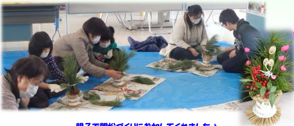
親子で門松づくりに参加してくれました♪