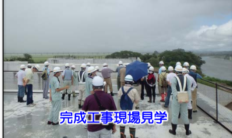
完成工事現場見学