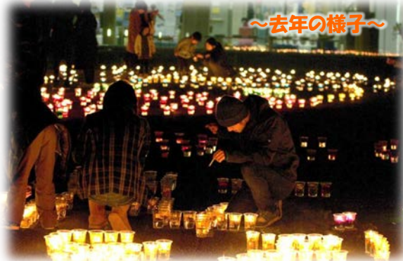
約1000個のキャンドルに火を灯しました

【主催】一関世代にける橋 【場所】北上川学習交流館 あいぽーと 【日時】平成29年12月2日(土) 17:00~19:00 【日程】17:00 キャンドル点火 (参加者のお手伝いお願いします) 17:45 ライトダウン(18:45 ライトアップ) 【同時イベント】