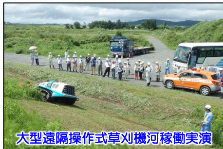
大型遠隔操作式草刈機河稼働実演