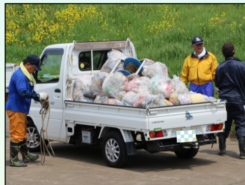
収集したゴミ軽トラ1台分