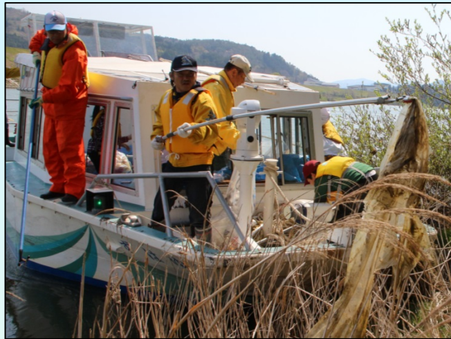
河川調査船ゆはずからゴミ拾い

4月29日(土)、「第27回 北上川クリーン大作戦!」が行われました。(川崎防災ステーションからユー・エス採石場付近まで)計39名の参加者が、調査船ゆはず、ゴムボート、長正丸の計6艇に乗り込み、木に巻き付いたゴミや川岸のゴミなどを拾い集めました。