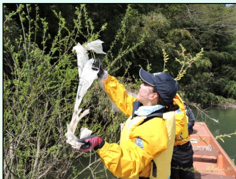
浅瀬のゴミは長正丸で取りました