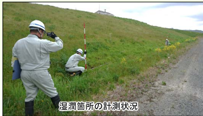
湿润箇所の計測状況

◆◆編集後記◆◆ 一関遊水地では、田植えの最盛期を迎えあちらこちらで朝早くから農家の皆さんが農作業に行っています。私の家でも今週末田植えです。農機具の取扱いには十分注意して事故の無いように行って下さい。(Y)