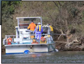
→北上川クリーン大作戦 船上からの清掃活動