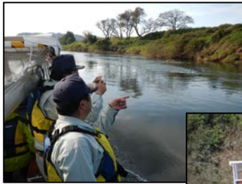
←河川巡視 法面などの点検