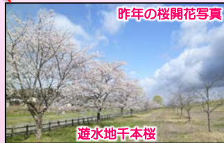
昨年の桜開花写真