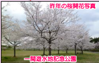
昨年の桜開花写真

http://www.thr.mlit.go.jp/bumon/j73101/homepage/index.html