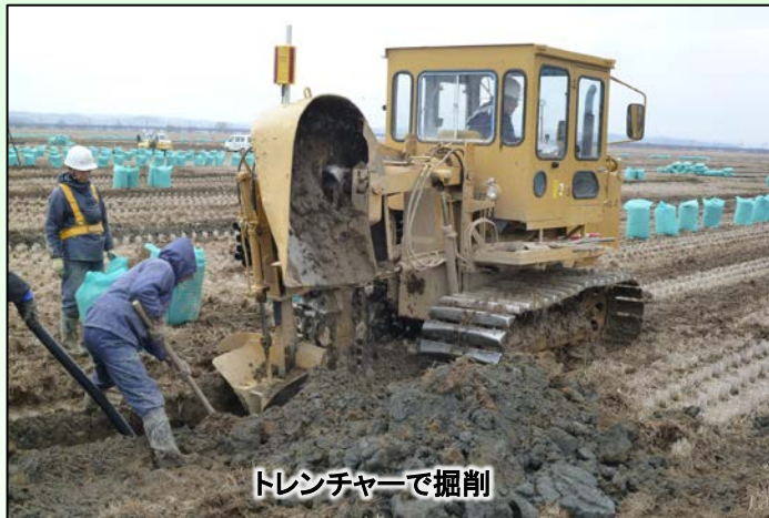
トレンチャーで掘削