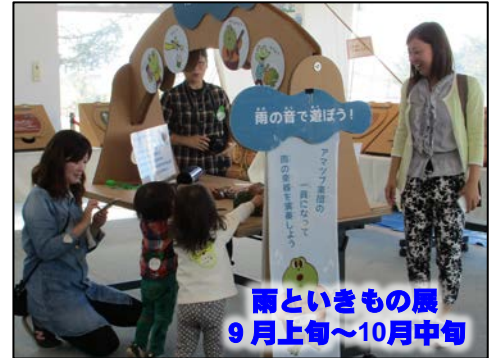
雨といきもの展 9月上旬～10月中旬