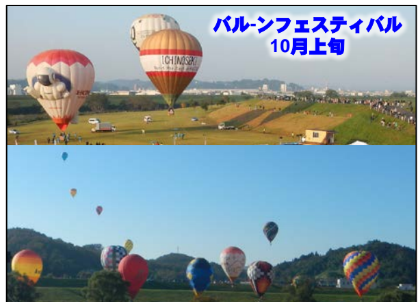
バルーンフェスティバル 10月上旬