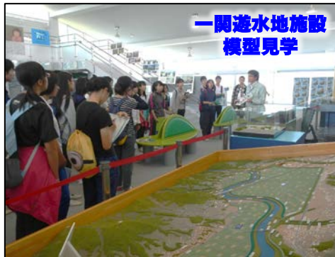
一関遊水地施設 模型見学