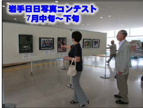
岩手日日写真コンテスト 7月中旬～下旬