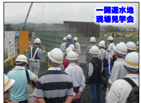
一関遊水地 現場見学会