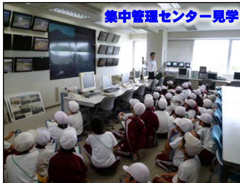
集中管理センター見学