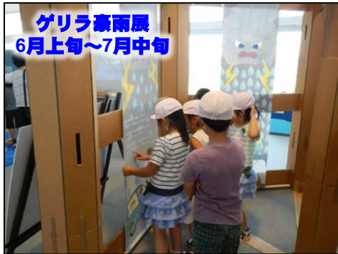
ゲリラ豪雨展 6月上旬～7月中旬