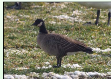
昨年見られたシジュウカラガン

■絶滅危惧種 IA類とは、ごく近い将来における野生での絶滅の危険性が極めて高いものとされているんだよ。