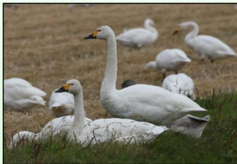
一関遊水地に飛来しているコハクチョウ

一関出張所管内では、オオハクチョウやコハクチョウの飛来が磐井川や北上川、一関遊水地に見られます。その他にも、アメリカコハクチョウやマガン、昨年は絶滅危惧種 IA類に指定されているシジュウカラガンがみられました。