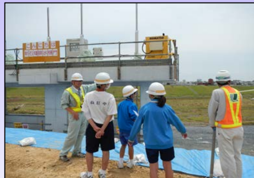
工事現場見学の様子

平成27年7月8日(水)、社会化実習生の私達は、最初に、堤防の草刈現場へ行きました。堤防の草刈をしないままだと堤防に開いた穴や、危険なところがわからないそうです。次に、樋門工場の現場に行きました。法面護岸ブロックを配置しているところなどを、見学しました。(S)