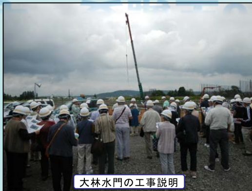
大林水門の工事説明

平成27年6月18日(木)、あいぽーとにて、中里市民センターが主催する中里大学(40歳以上対象)の一般教養講座「災害に備えて」が開催されました。北上川に関連する河川の特性・水害・災害情報などについて説明を受けた後、あいぽーと施設内や一関遊水地事業の工事現場を見学されました。