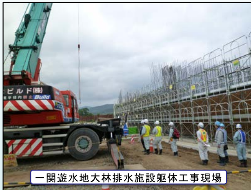
一関遊水地大林排水施設躯体工事現場

平成27年6月17日(水)、一関地区安全パトロールを行いました。「安全パトロール」とは、発注者(岩手河川国道事務所)と受注者(施工業者)の安全管理担当者が合同で、管内の施工現場をパトロールし、安全管理に問題がないかをチェックするものです。パトロール後には、あいぽーとにて改善点や見習う点など活発な意見交換をおこないました。