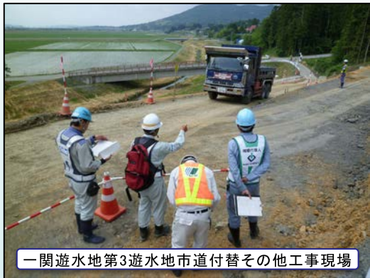
一関遊水地第3遊水地市道付替その他工事現場