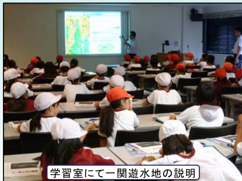
学習室にて一関遊水地の説明

平成27年6月19日(金)、山目小学校4年生が「総合学習」のために、北上川学習交流館 あいぽーとを訪れました。一関出張所より、一関遊水地やあいぽーとの役割についての説明や、事前にもらった「なぜ台風は発生するのか」などの質問事項にも、イラストなどをつかい説明がおこなわれました。幅広い世代の方々にあいぽーとを利用いただいております。