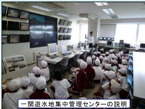
一関遊水地集中管理センターの説明