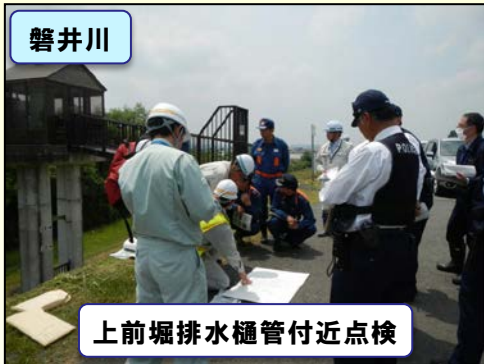
上前堀排水樋管付近点検