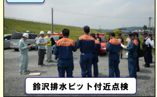
鈴沢排水ピット付近点検