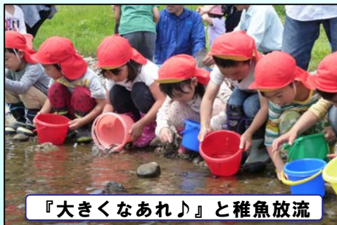
『大きくなあれ♪』と稚魚放流

◆◆編集後記◆◆ あいぽーとにて、「ゲリラ豪雨展」が始まりました！昨年好評だったことから、今年も展示することになりました。是非お誘い合わせのうえ、体験しに来てみて下さい☆ (Y)