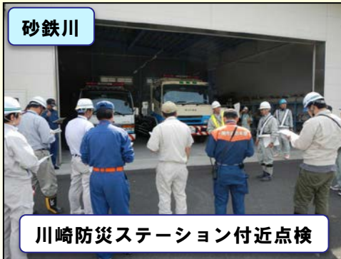
川崎防災ステーション付近点検