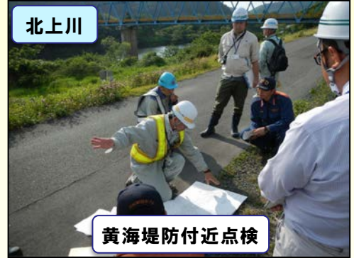
黄海堤防付近点検