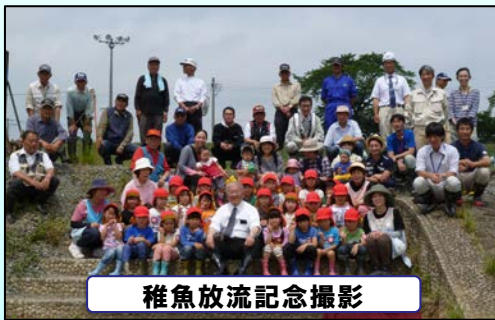
稚魚放流記念撮影

平成27年5月29日(金)に、磐井川魚資源保護鮎放流事業の一環として稚魚放流会が開催されました。この事業は、磐井川の魚資源の保全や環境美化などを目的として行われています。3箇所の放流場所では、鮎やヤマメの稚魚約1万5千尾が放流されました。磐井川河川緑地公園にある白鳥ふれあいの水辺に集まった、一関市立一関あおば保育園の園児や一般参加者約60名は、「大きくなあれ♪」のかけ声に合わせて放流していました。