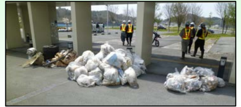
一関水辺プラザで回収されたゴミ