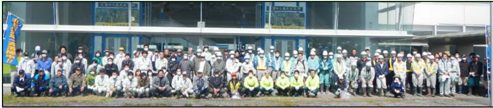
一関水辺プラザの清掃活動に参加された皆さん

平成27年4月18日(土)に、今回で8回目となる北上川一斉清掃が行われ各出張所管内の清掃場所には多くの方が訪れ清掃活動にご尽力いただきました。一関市では、一関・川崎水辺プラザや磐井川緑地公園、東山地区、日形地区などで清掃活動が行われ、約500名の地域の皆様に参加して頂きました。