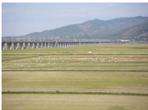
↑「あいぽーと」付近の周囲堤から。ざっと数えても100羽以上が集っています。

前々号のNo.106号では秋の使者「サケ」の遡上を紹介しましたが、この時期には磐井川や一関遊水地で沢山のハクチョウも見ることができます。あいぽーとからも、遊水地内の田んぼにエサを求めて集まっている風景を見ることができ、出張所職員も朝は磐井川から、夕方には磐井川に帰っていくハクチョウの姿や鳴き声に癒されています♪