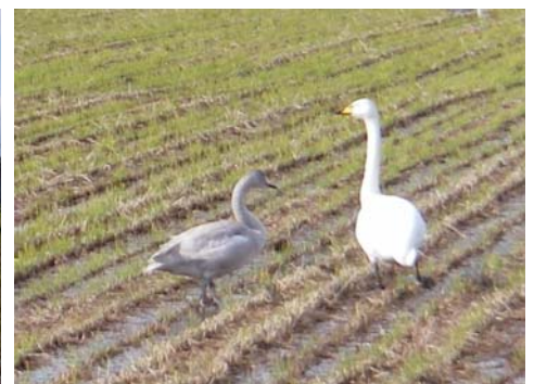
↑羽が灰色なのは今年生まれた子供だそうです。写真の2羽は親子でしょうか？