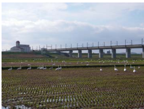
↑稲刈り後に田んぼに残った落ち籾を食べに集っているようです。