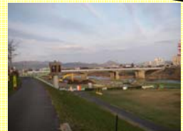
3月完成に向け鋭意施工中です!!

また、立入禁止箇所にはフェンスなどを設置しています。危険ですので立ち入りすることのないようご協力をお願いします。