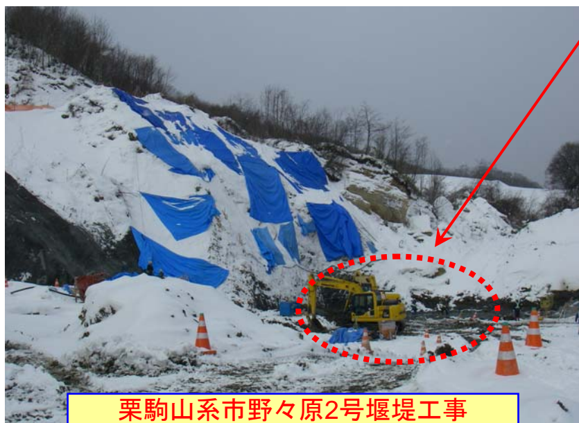
栗駒山系市野々原2号堰堤工事