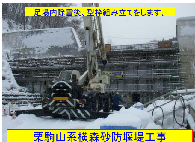
足場内除雪後、型枠組み立てをします。