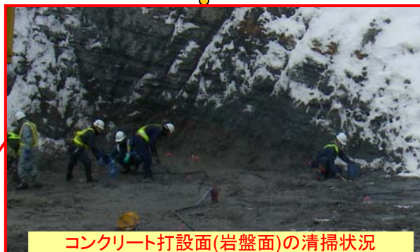
コンクリート打設面(岩盤面)の清掃状況

写真は1/6(金)栗駒山系直轄特定緊急砂防事業の様子です。当該箇所は市街地より積雪が多いため、除雪してから作業を行います。残りの工事について、降積雪と気温低下による「事故及び災害」に注意し「品質」にも気を配りながら、作業を進めてまいります。