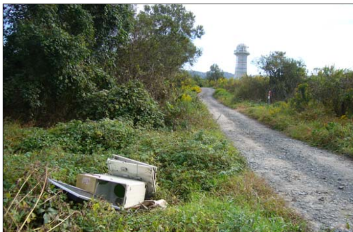
河川敷に不法投棄された家電製品