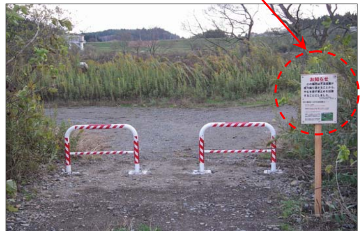
不法投棄防止の注意喚起施設