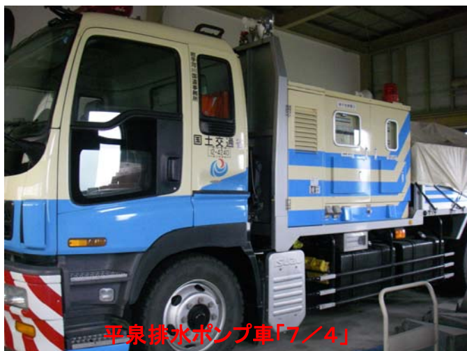
平泉排水ポンプ車「7/4」

初めての職場体験で緊張したけれど、あいぽーとで働く人たちは優しく教えてくれました。排水ポンプ車は、消防車よりパワーがあり、災害支援に役立っています。右下の写真は、水質検査をしている様子です。この検査は、川の健康診断のようなものでした。