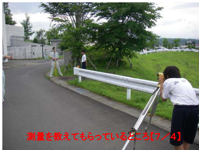
測量を教えてもらっているところ【7/4】