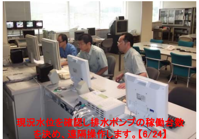
現況水位を確認し排水ポンプの稼働台数を決め、遠隔操作します。【6/24】