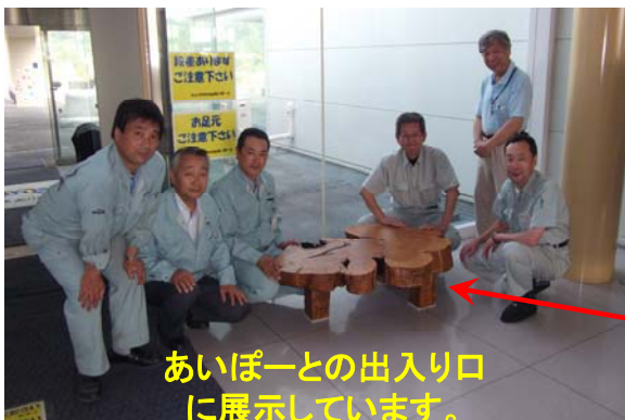
あいぽーとの出入りに 展示しています。