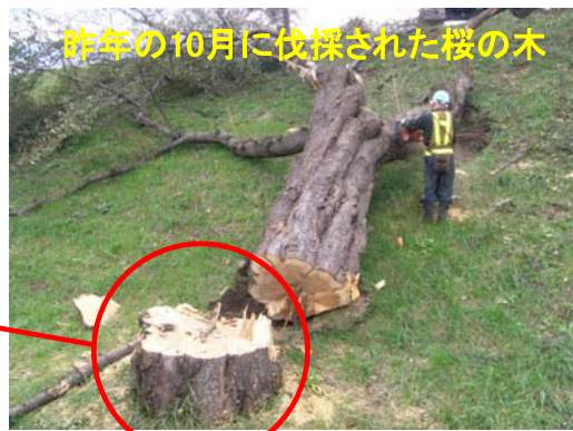
昨年の10月に伐採された桜の木

磐井川堤防改修事業の桜木町排水樋門工事で、支障となる桜の木が惜しまれつつ伐採されました。この地域に桜の木があったことを後生に伝えることと、伐採木の有効利用の目的で、あいぽーとへ工事業業者よりテーブルが寄贈されました。