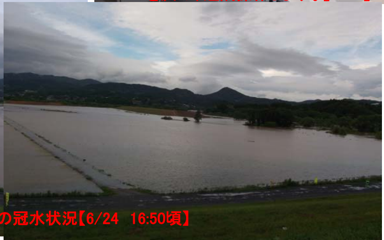
第一遊水地の冠水状況【6/24 16:50頃】