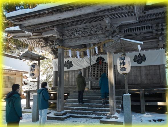
一関市内の配志和神社に参拝し、無事故・無災害を祈念しました。

新年明けましておめでとうございます。 昨年も、「i-report」をご愛読いただきありがとうございました。 今年も、皆様に一関地区内の工事や地域情報、あいぽーとの展示情報などを、たくさんお伝えできるよう努力していきたいと思っております。 本年もどうぞよろしくお願いいたします。