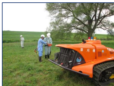
遠隔式草刈機械操縦体験