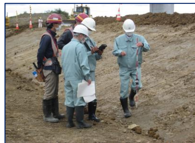
測量体験(越流堤築堤工事)