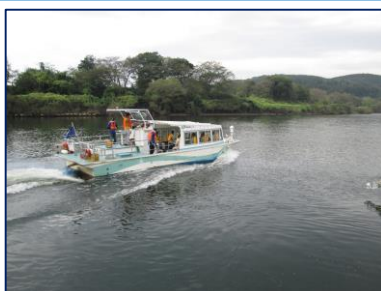
北上川河川調査(ゆはず搭乗)