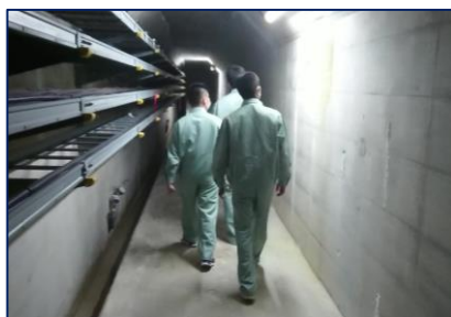
胆沢ダム(内部)見学