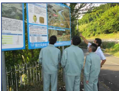
一関遊水地展望台見学