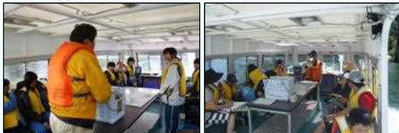
一日河川調査員を体験