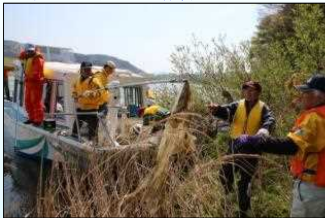
調査船での清掃活動