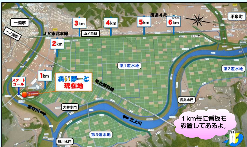
一関遊水地全体イメージ図