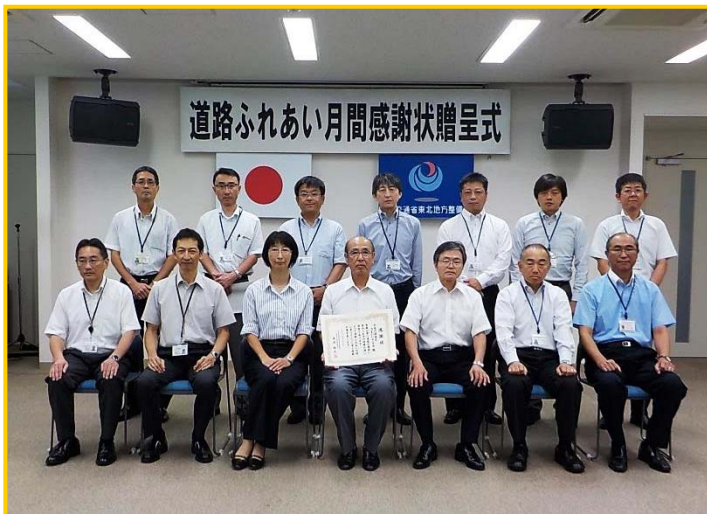
「平泉を綺麗にする会」様の活動の様子