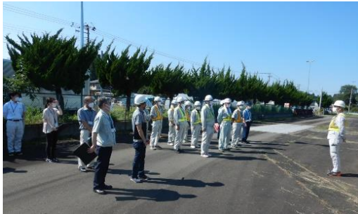
奥州警察署ご協力のもと約30名で実施

特殊車両の通行許可条件を守ることは、交通の安全確保や道路構造物の損傷防止につながります。事前の申請と許可条件を守って走行していただくよう、お願いいたします。