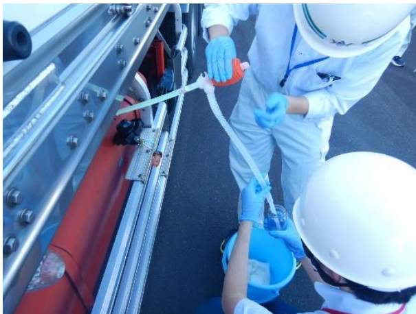
軽油のサンプルを採取し、成分不正がないか分析 (県南広域振興局実施)