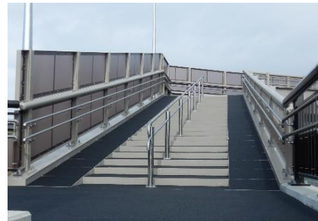
やわらかいゴムチップ舗装により、やさしい歩行性となっています。