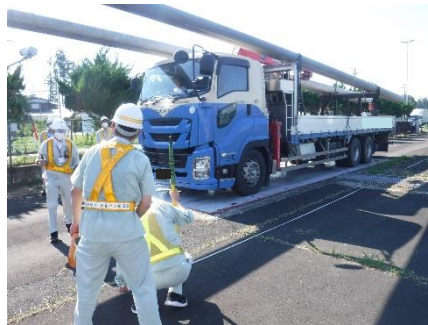
積載分の長さも含め計測します。