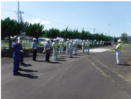
約20名でおこないました。

今回は、約2時間で調査した7台のうち、1台の違反車両に対して指導をおこないました。ドライバーのみなさん、道路保全と交通の危険防止のためにも、事前の申請と許可条件を守って走行していただきますよう、お願い申し上げます。