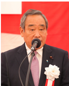
▲大西 英男 国土交通副大臣 挨拶