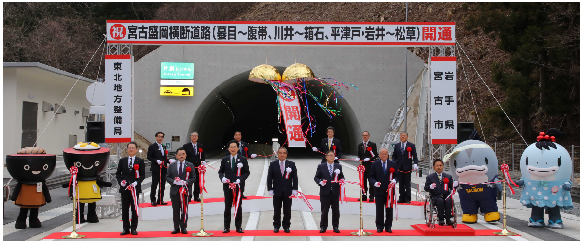
▲テープカット及びくす玉開き