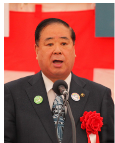
▲谷藤 裕明 盛岡市長 御礼の言葉