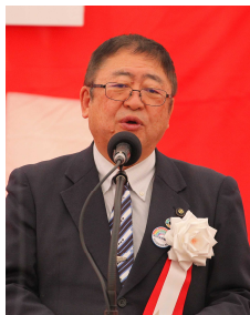
▲山本 正徳 宮古市長 挨拶