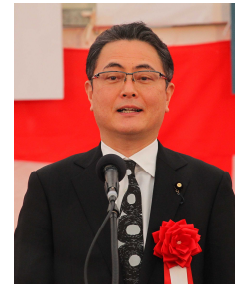
▲木戸口 英司 参議院議員 祝辞