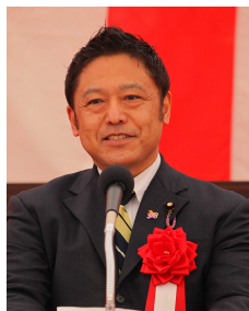
▲横沢 高徳 参議院議員 祝辞