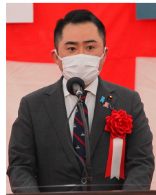
▲吉川 起 復興大臣政務官 祝辞