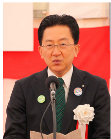
▲達増 拓也 岩手県知事 挨拶