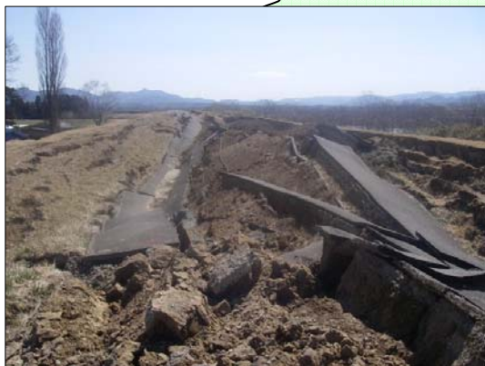
阿武隈川（枝野地区） 被災直後状況