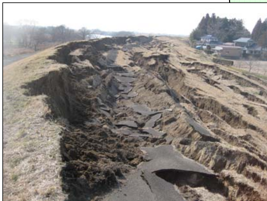
鳴瀬川（下中ノ目地区） 被災直後状況